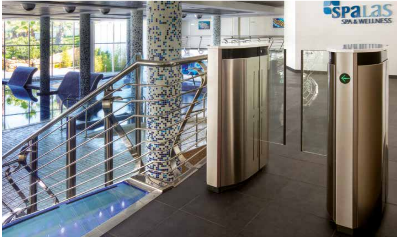
Express Gate à verre faible hauteur. Secteur de l'hôtellerie.