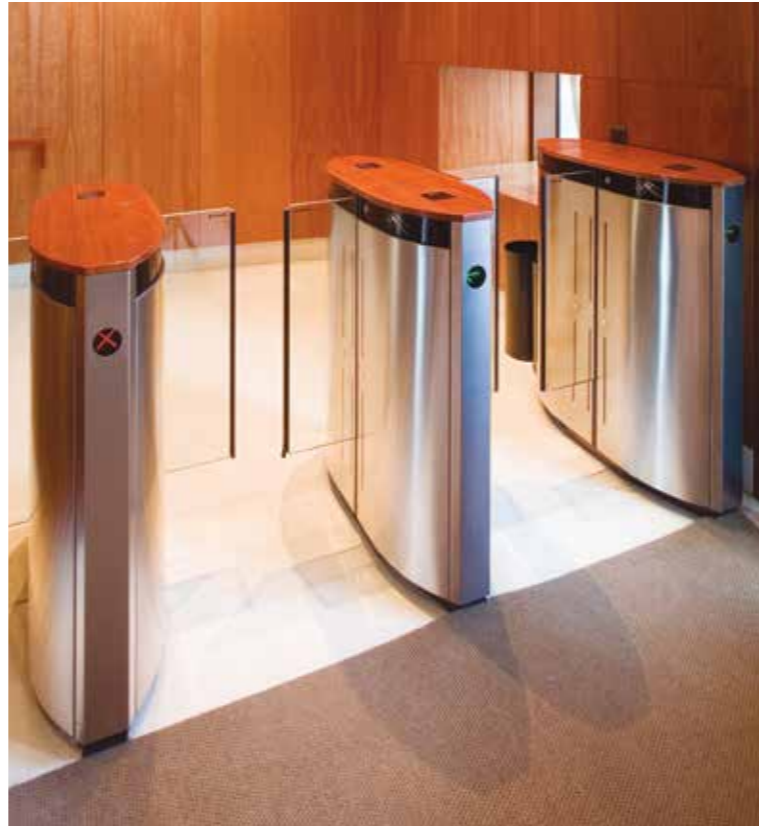
Express Gate à verre faible hauteur. Institution culturelle.