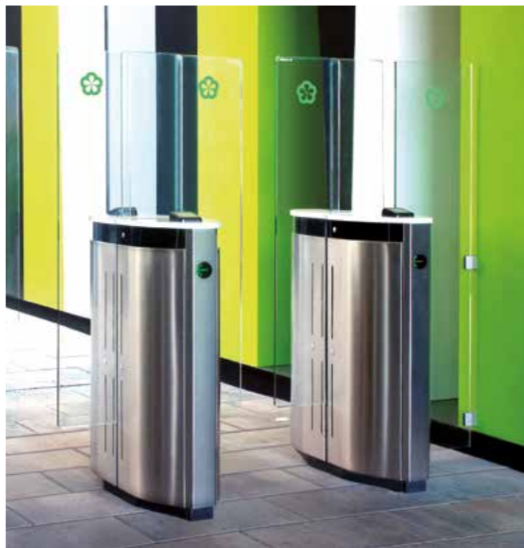
Express Gate à verre grande hauteur. Résidence étudiante.

Les dispositifs Express Gate de Manusa sont composés d'un mobilier élégant servant de support à des panneaux en verre et renfermant des photocellules de sécurité, des lecteurs de contrôle d'accès, ainsi que le système exclusif Manusa pour l'ouverture de portes en toute sécurité.