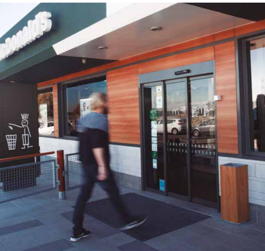
Porta automática de abertura telescópica. Sector restauração.

São ideais para entradas com limitações de espaço, para separações de corredores, ou onde seja necessária uma amplitude de passagem livre maior do que a habitual como, por exemplo, em concessionários de automóveis.