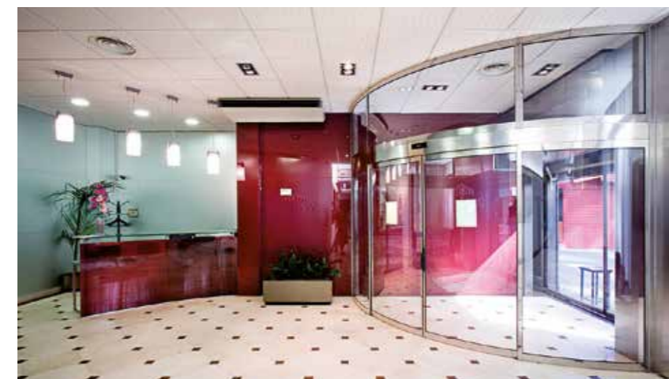
Porta automática circular. Biblioteca.