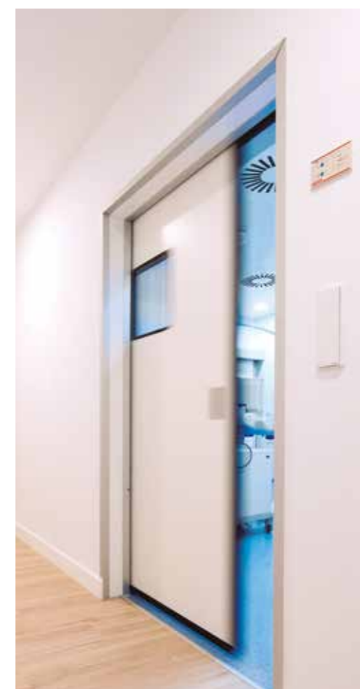
Portas herméticas de correr. Área cirúrgica hospitalar.

Todo o conjunto da porta foi desenhado para garantir a higiene: óculo nivelado, puxador, materiais de fácil limpeza.