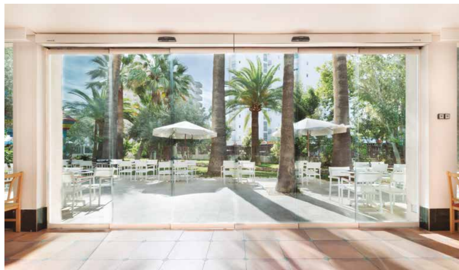
Porta automática de abertura telescópica. Sector hoteleiro.

Porta de correr de 2 folhas móveis que se deslocam lateralmente. As folhas móveis recolhem uma sobre a outra para libertar o máximo espaço de passagem num dos lados da porta.