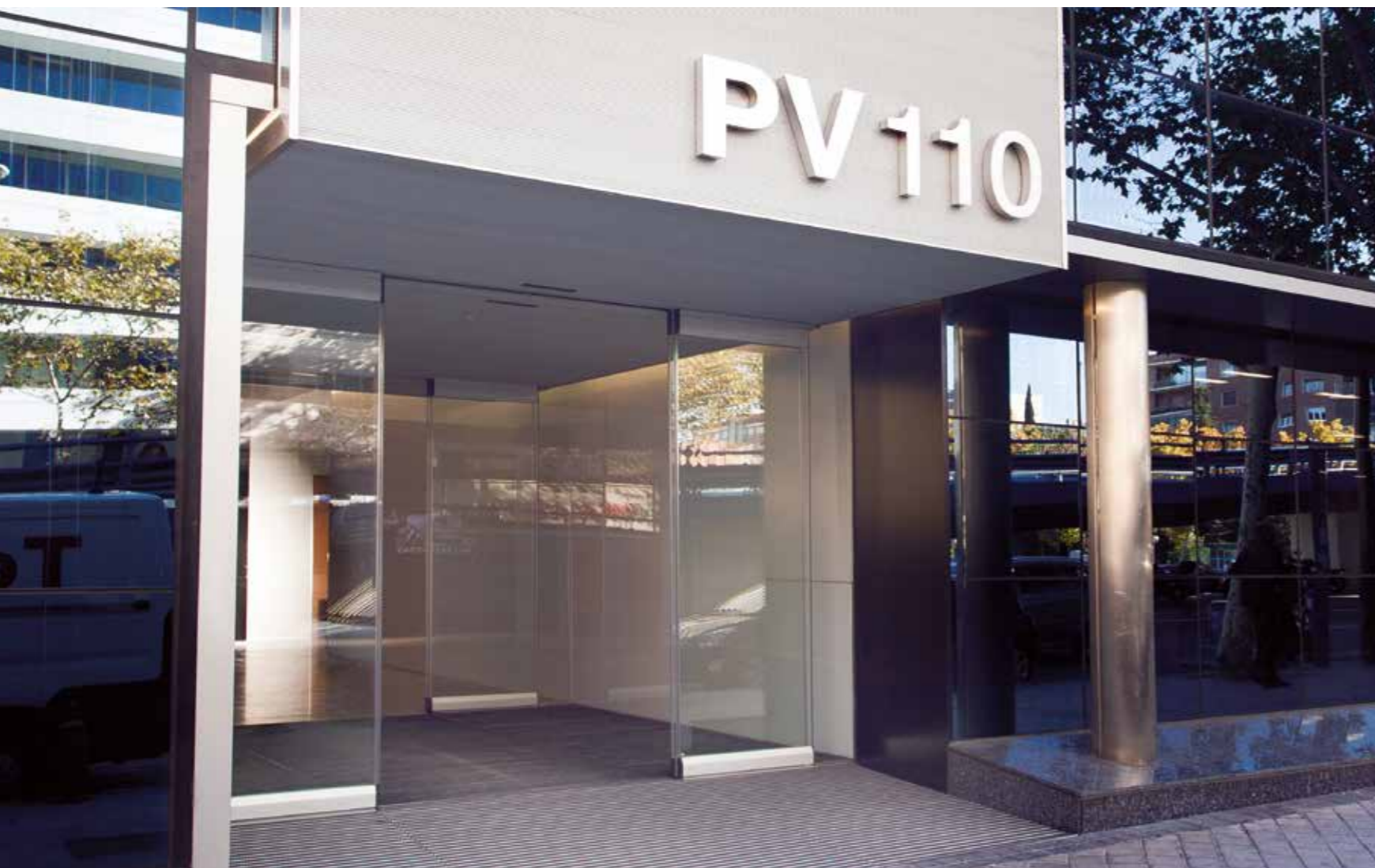
Porta antipânico com folhas sem perfilaria vertical. Edifício de escritórios.

As portas de correr com mecanismo antipânico da Manusa combinam a funcionalidade de uma porta de correr com a possibilidade de abatimento das folhas, permitindo assim maximizar a zona de passagem.