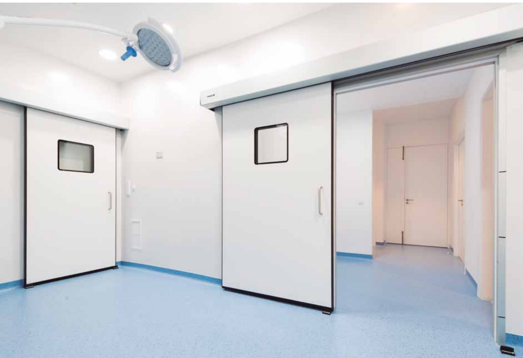
Portas herméticas de correr. Área cirúrgica hospitalar.

As portas herméticas Manusa reúnem as vantagens de uma porta automática com a hermeticidade e higiene requeridas em ambientes limpos.