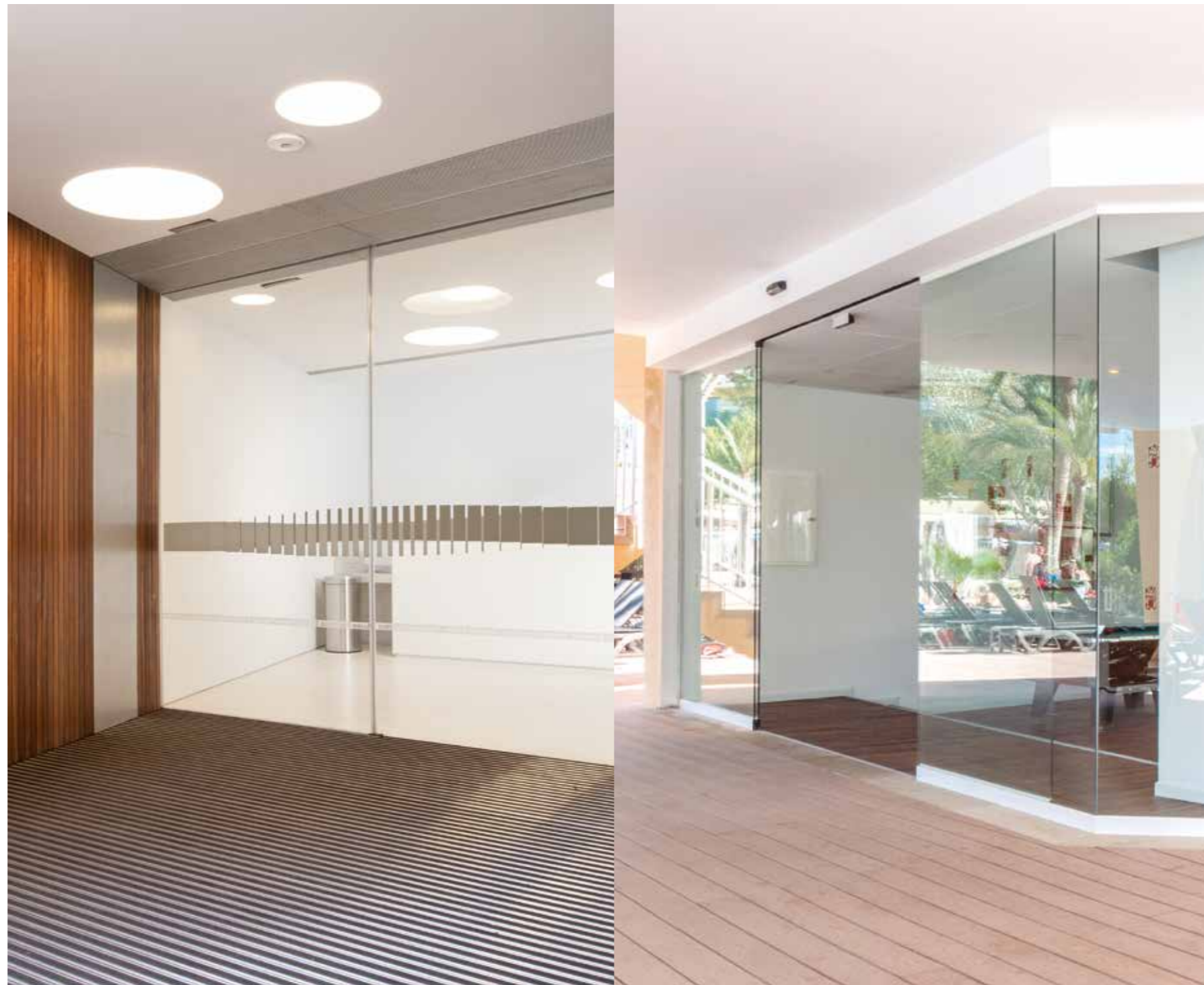
Porta de abertura com folhas totalmente transparentes, opção perfil oculto. Sector museus.