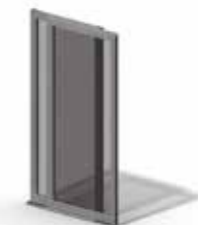
Moldura de 45 mm

Aplicável em portas automáticas de correr de abertura central e lateral.