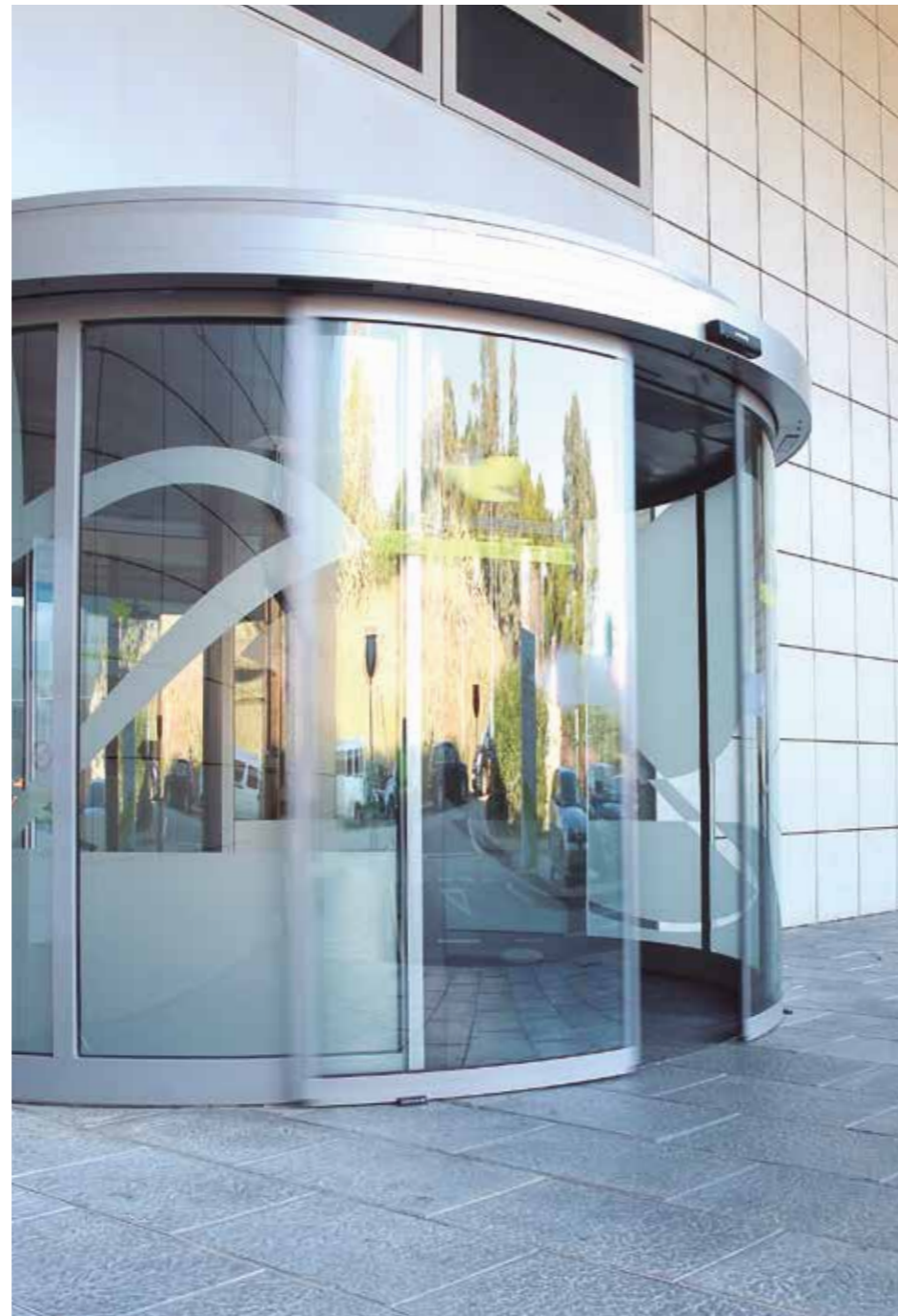
Porta automática circular. Sector hospitalar.

A porta pode ser côncava ou convexa e com diferentes raios e graus de curvatura. A combinação de duas portas curvas permite a criação de portas circulares, ideais para entradas singulares e funcionais ao mesmo tempo.