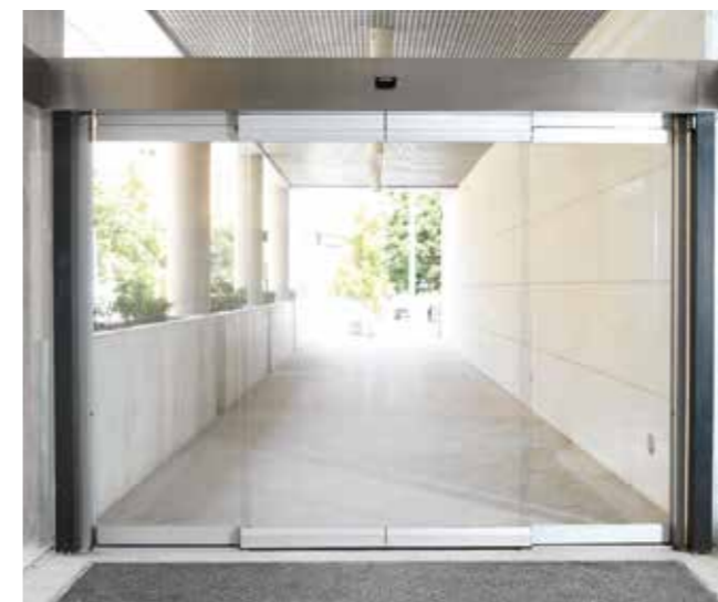
Porta antipânico com folhas sem perfilaria vertical. Sector centros comerciais.

A porta funciona em modo normal (de correr e automática). Em caso de emergência, as folhas abatem-se empurrando manualmente para o exterior e dobram-se nos lados, para permitir uma ampla passagem livre de evacuação.