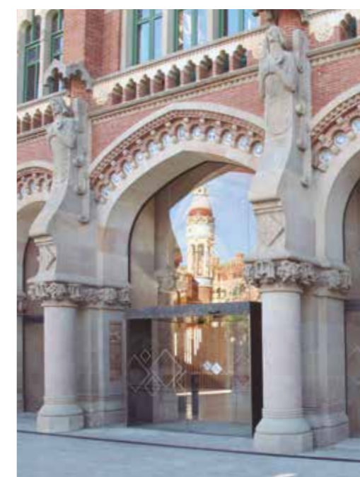
Porta automática de abertura lateral. Sector museus.