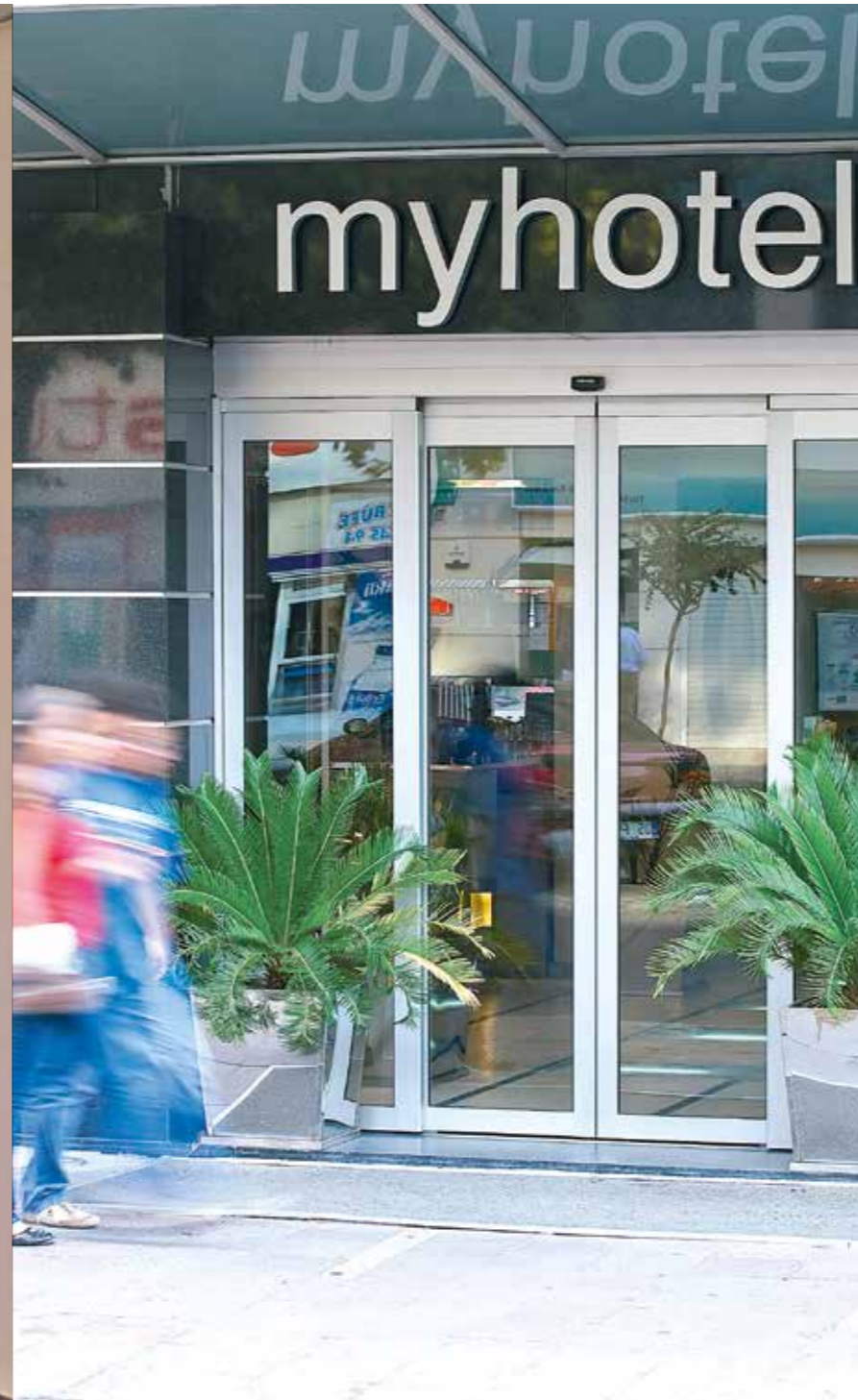
Porta de correr central especial com folha encaixilhada e moldura reforçada. Sector hoteleiro.

Folhas com perfil reforçado em todo o seu perímetro.