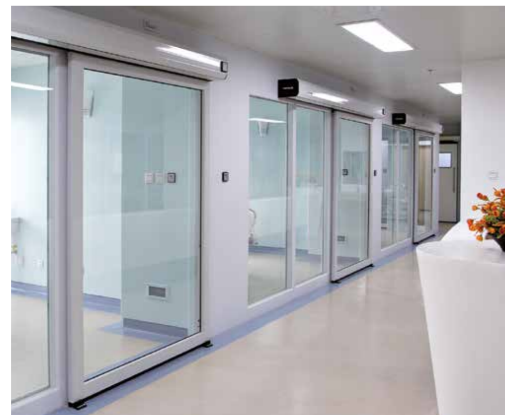
Portas herméticas envidraçadas Clear View. Unidade de vigilância intensiva hospitalar.