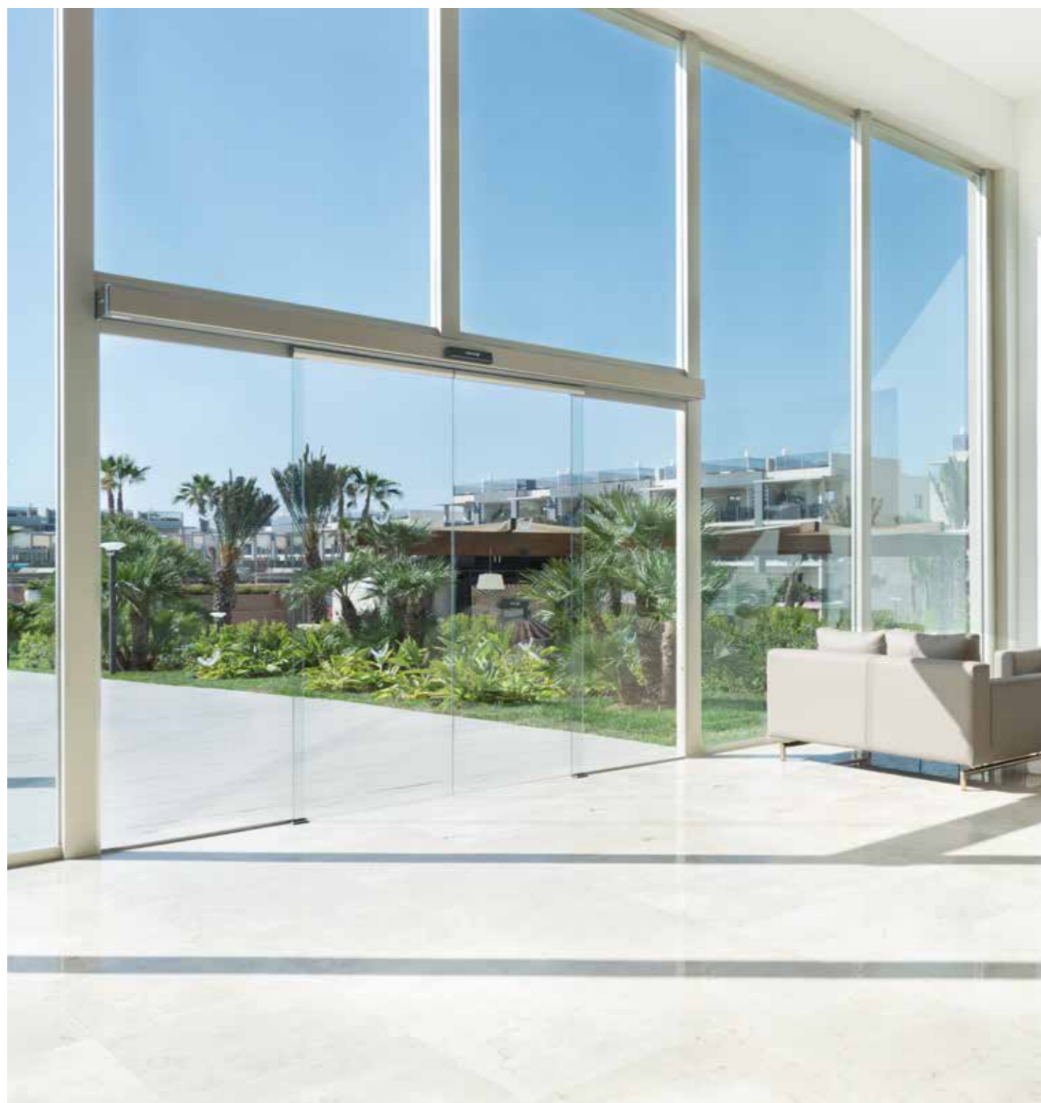
Porta automática de abertura central. Sector hoteleiro.

As portas centrais e laterais Manusa oferecem a máxima velocidade de abertura do mercado, junto com a máxima segurança. São recomendadas em entradas e saídas públicas onde a circulação de pessoas seja intensa ou onde a segurança dos usuários esteja vinculada com a fluidez do tráfego.