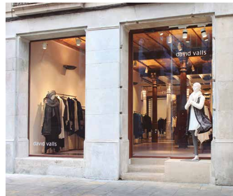
Porta automática de abertura lateral. Sector comércio.