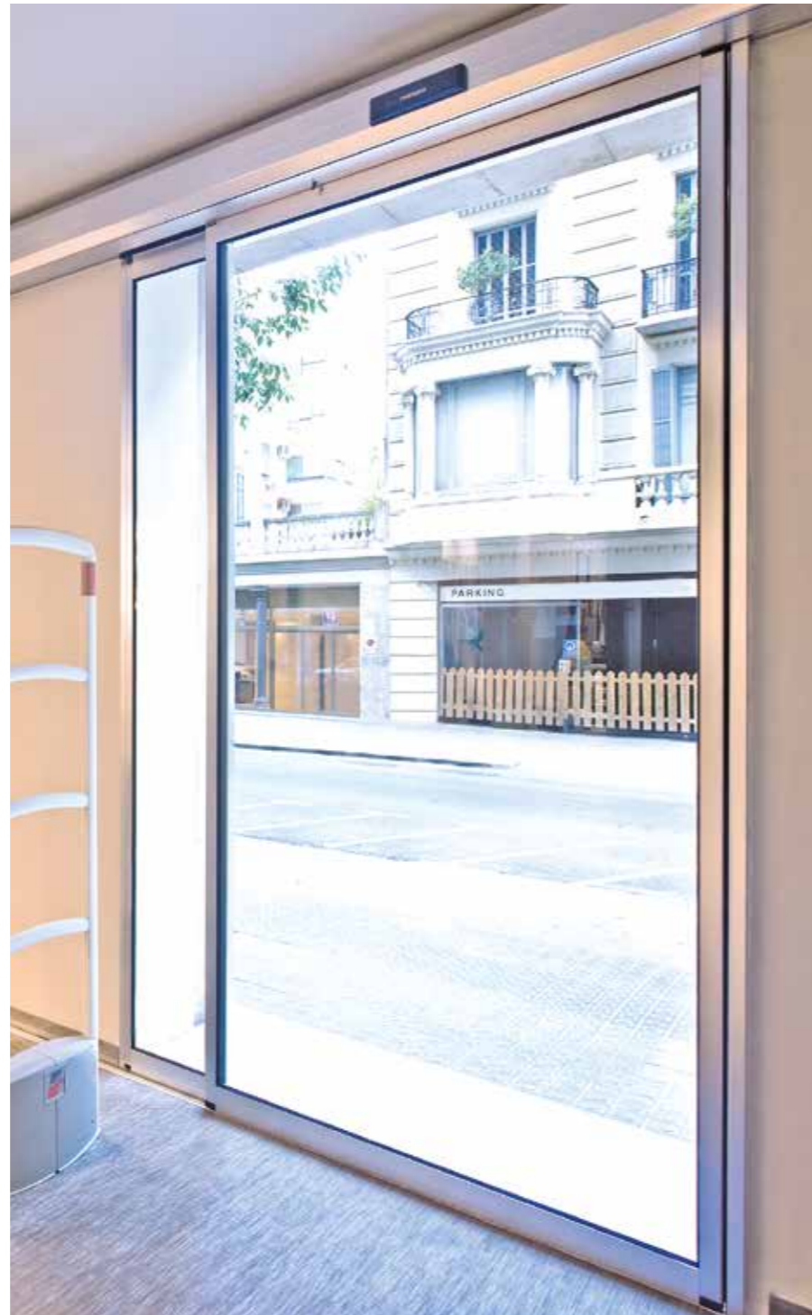
Porta de correr lateral com folha encaixilhada. Sector comércio.