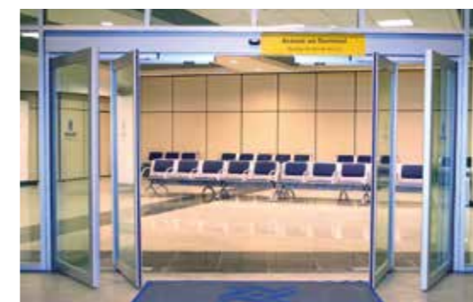
Porta antipânico com folhas encaixilhadas. Sector aeroportos.

Sistema antipânico com folhas encaixilhadas (A45-S4): as folhas deslizantes e rebativeis são completamente encaixilhadas com perfil de 45 mm e oferecem uma grande resistência e durabilidade, e são aptas para entradas de tráfego intenso.