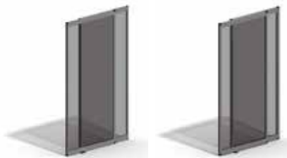
Moldura de 20 mm Moldura de 30 mm

Aplicável em portas automáticas de correr de abertura central, lateral, telescópica, curva e semicircular.